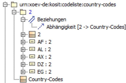
Abbildung 3.4. Struktur der Bestandteile der Codeliste Country Codes

Für jede Codeliste wird ein eigenes UML-Paket erstellt, dessen Name der Kennung der Codeliste entspricht. Für jede Codelistenversion wird ein eigenes UML-Paket unterhalb des Pakets der Codeliste angelegt, welches die jeweilige Versionsangabe (Eigenschaft version des Stereotyps xoevVersionCodeliste) als Namen erhält. Die Codelisteneinträge werden im UML-Paket der Codelistenversion abgelegt.